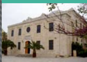
ΙΕΡΟΣ ΝΑΟΣ ΑΓΙΟΥ ΤΙΤΟΥ