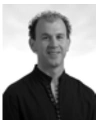
Γιάννης Ιδομενός, Βαρύτονος