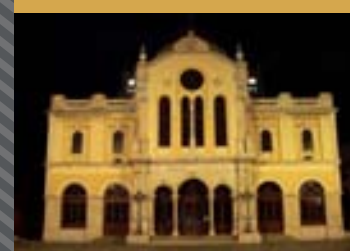
ΙΕΡΟΣ ΜΗΤΡΟΠΟΛΙΤΙΚΟΣ ΝΑΟΣ ΑΓΙΟΥ ΜΗΝΑ