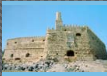
ΘΑΛΑΣΣΙΟ ΦΡΟΥΡΙΟ (ΚΟΥΛΕΣ)