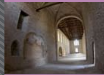
ΜΟΝΗ ΑΓΙΟΥ ΠΕΤΡΟΥ & ΠΑΥΛΟΥ