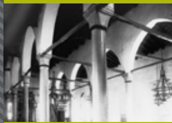
ΒΑΣΙΛΙΚΗ ΑΓΙΟΥ ΜΑΡΚΟΥ